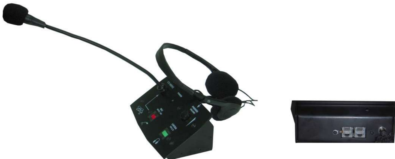
- LOOP mikrofoni sa slušalicama -