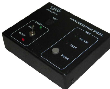
mikrofon za pozivanje