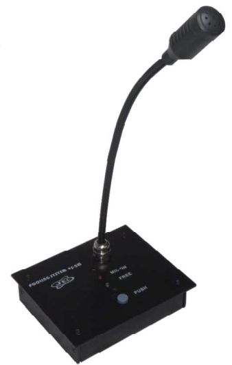
mikrofon za pozivanje sa vratom